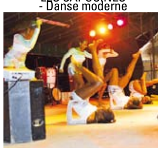
LES CAPUCINES - Danse moderne