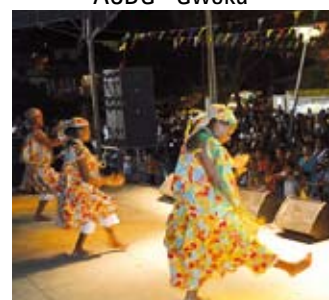
ACDG - Gwoka