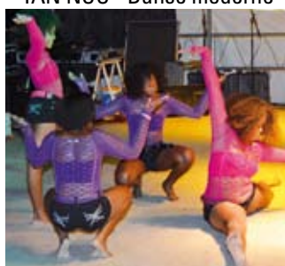
TAN NOU - Danse moderne