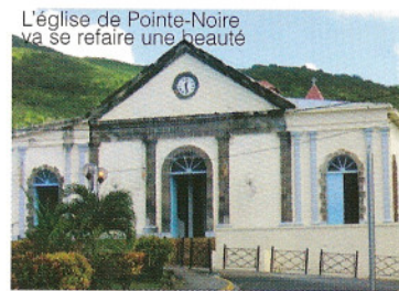
L'église de Pointe-Noire va se refaire une beauté

Le second consiste en la réhabilitation du clocher de l'église de la commune et sa toiture.