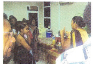
Une fin de journée récompensée par une cuisine typiquement indienne