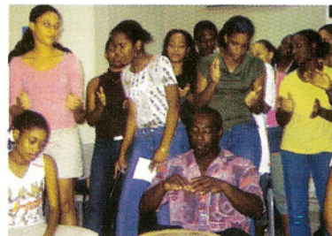
Les Pointe-Noiriens ont démontré ce jour un intérêt particulier à la culture indienne.

Faire connaître à nos concitoyens les différents apports de la communauté indienne à notre société mais aussi valoriser la culture indienne, tels ont