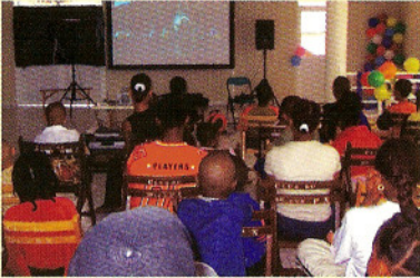
Noël des enfants à la bibliothèque

Le lendemain, 84 enfants défavorisés inscrits par le CCAS participaient à une réception donnée à la Bibliothèque et animée par Ciné Woulé. Chacun des parents s'est vu remettre un