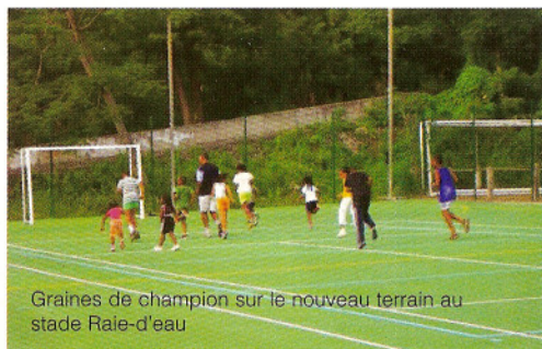
Graines de champion sur le nouveau terrain au stade Raie-d'eau