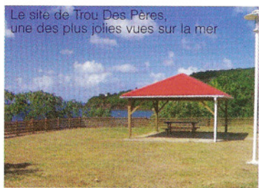
Le site de Trou Des Pères, une des plus jolies vues sur la mer

- Sur l'ensemble de la commune : des travaux de fauchage et d'élagage ont été