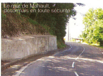
Le mur de Mahault, désormais en toute sécurité

Depuis l'arrivée de la nouvelle majorité au Conseil Régional et devant l'insistance de la Municipalité, le mur de soutènement de Mahault a été réparé parant ainsi les dangers que pourrait représenter cet édifice lors de fortes intempéries, et une sécurisation nécessaire pour les conducteurs.