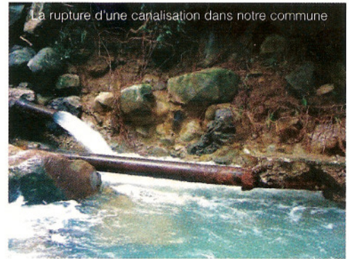
La rupture d'une canalisation dans notre commune

Nous ne manquerons pas de vous tenir informés sur l'avancée de ce dossier dans nos prochains numéros ; sachez toutefois que la Mairie de Pointe-noire envisagerait à son tour de s'équiper de citernes afin de stocker l'eau.