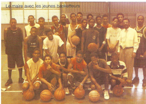
Le maire avec les jeunes basketteurs