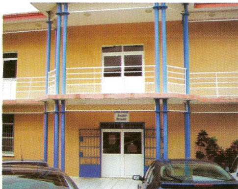
Bibliothèque Ancelet Bellaire

Équipement de base de la vie culturelle locale, la bibliothèque municipale est un espace convivial, accessible à tous et au service de tous sans exclusion aucune.