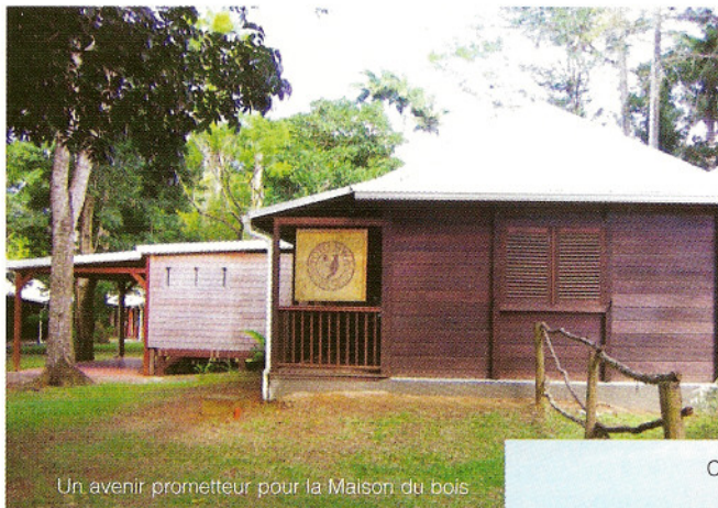
Un avenir prometteur pour la Maison du bois

Jusqu'à-là propriété du Parc National, La Maison du Bois, a été ré-attribuée à la Ville de Pointe-Noire depuis le mois de décembre 2004.