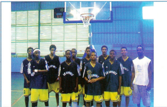
Nos vaillants basketteurs savent défendre nos couleurs.

Tandis que les seniors de l'EDO atteignaient le stade de la demi-finale des play off de leur catégorie, les Cadets de la Luciole, finalistes en Coupe de la Guadeloupe et en Championnat peuvent s'enorgueillir de faire partie du haut du panier des équipes cadets de notre département. Ils savent tous deux, dans leur catégorie respective nous offrir le spectacle d'une équipe sachant tenir leur rôle avec vaillance et en donnant l'exemple aux futurs jeunes basketteurs. Les 3 et le 4 avril dernier, c'était la fête du basket à Pointe-Noire.