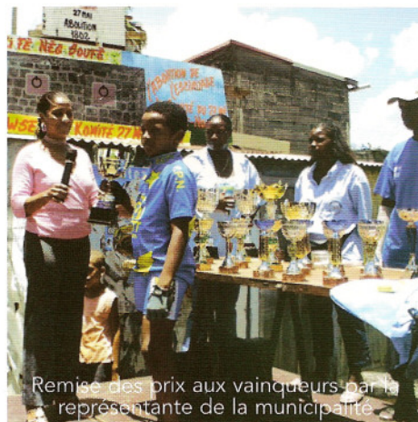
Remise des prix aux vainqueurs par la représentante de la municipalité.

Cette année, le Foyer socio-culturel a tenu à participer en proposant au public une exposition visant à faire connaître l'histoire de l'affranchissement des esclaves avec la découverte d'actes légaux d'affranchissement, l'origine des familles de Pointe-Noire, des photos ou encore l'exposition d'objets anciens. Les écoles ont spontanément participé, chacune à leur manière à cette journée commémorative. Le comité du 27 mai avait pour l'occasion organisé une course cycliste.