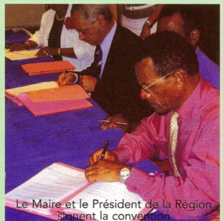
Le Maire et le Président de la Région signent la convention.

Le 23 juin dernier, la convention tripartite a été signée entre la municipalité, la Région et la Caisse des dépôts et Consignations, seul organisme habilité à accorder le label "Cyberbase".