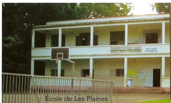
École de Les Plaines

autres, celle à minima d'une fermeture de classe, à maxima la fermeture de l'école car la réduction du nombre d'élèves inscrits dans une école est un grave problème. En envoyant leurs enfants dans une section autre que celle où vit la famille, les parents ne risquent-ils pas de dépayser leurs enfants et de faire ainsi que cette séparation nuise aux relations indispensables entre les enfants d'un même quartier. L'école de Les Plaines a pris conscience à temps de ce problème.