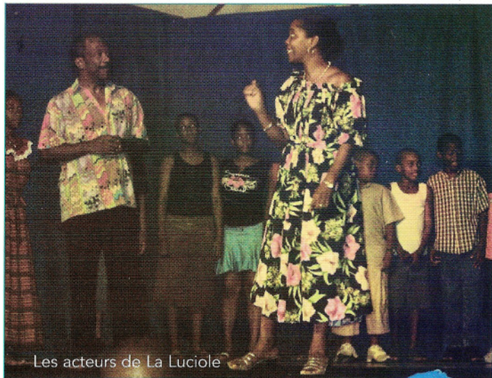
Les acteurs de La Luciole

La reprise se fera au mois d'octobre 2005 et pour tout renseignement, vous pouvez la contacter au 0590 98 02 50.