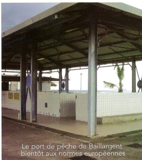
Le port de pêche de Baillargent bientôt aux normes européennes